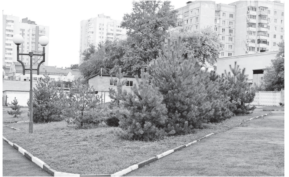
Школьный сосновый бор

движения не на уровне «красный — стоп, жёлтый — приготовиться, зелёный — иди». А, если можно так выразиться, углублённо. Более того, занятия по ПДД с ребятами проводят сами госавтоинспекторы.