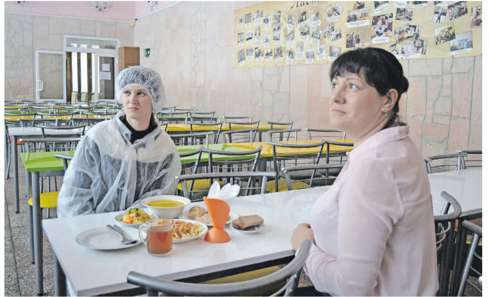
В школе действует система родительского контроля за питанием в столовой

— А новый стадион какой! Мы приходим заниматься и после уроков.