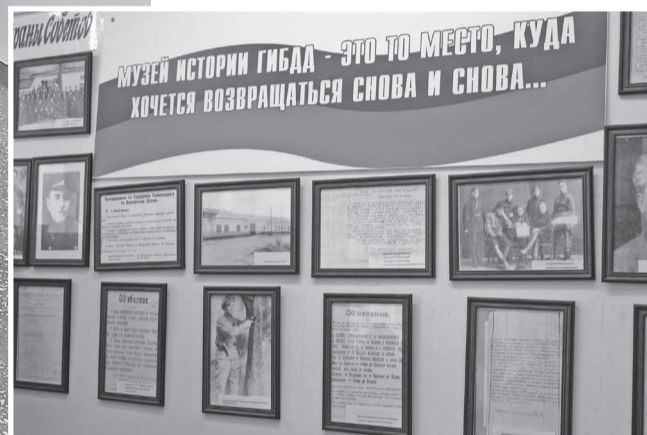
В школьном музее истории ГИБДД

«Да, это обычная школа!» — часто можно услышать в адрес учебного заведения, которое не лицей, не гимназия, не центр образования, а действительно — обычная общеобразовательная школа. Только вот произносить эти слова нужно не с оттенком пренебрежения. А, представьте себе, с гордостью: да, школа обычная, но почему же сюда стремятся дети не только из микрорайона, но и из крутых школ часто переходят? Почему все учебные места заполнены и детские папки с портфолио не вмещают всех дипломов, грамот, благодарностей?