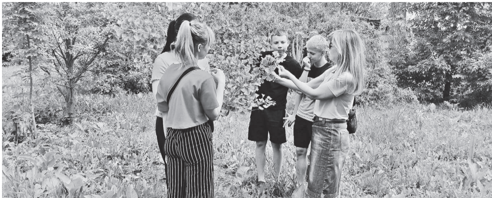
Старооскольские юннаты изучают реликтовое дерево гинкго во время экспедиции «По тропинкам родного края».