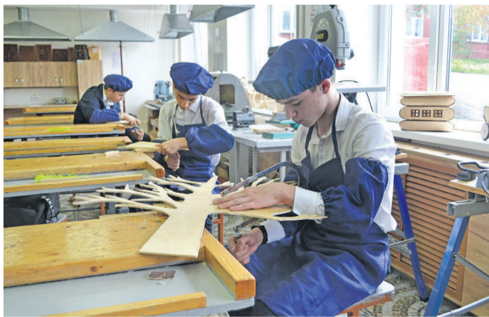
В школьной мастерской