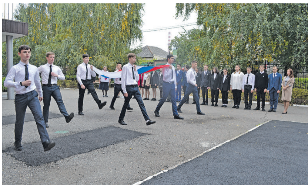
В 13-й школе, как и по всей России, новую учебную неделю начинают с поднятия гостфлага и исполнения гимна РФ