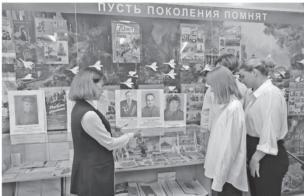
В школьном военно-патриотическом музее

Внутри школы светло и просторно. Несмотря на то что в этом учебном году 48-я школа приняла ребят и педагогов из школы № 45 — там идёт капитальный ремонт.