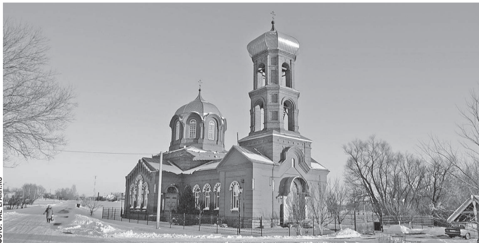
Храм святителя Тихона Задонского в селе Нижняя Серебрянка Ровеньского района

К примеру, с 20 по 24 июня проходила летняя экологическая экспедиция «По тропинкам родного края». Ребята успешно справились с задачами, стоящими перед экологической экспедицией: сформировать определённый объём знаний по экологии, приобрести навыки научного анализа явлений природы, осмысления взаимодействия общества с природой, осознать значимость своей практической помощи природе. Формирование таких качеств особенно эффективно происходит в процессе самостоятельной поисково-исследовательской деятельности.