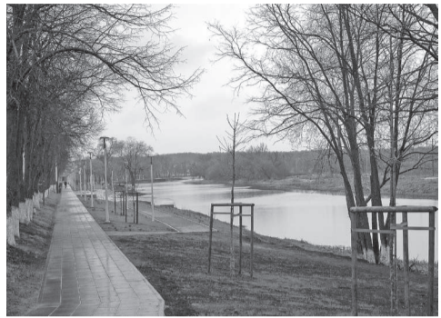
Набережная в Шебекино

ПУТЕШЕСТВИЯ ПО РОДНОМУ КРАЮ КАК ПУТЬ К ПАТРИОТИЗМУ