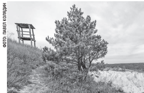
Меловая сосна Бекариюковского бора в Шебекинском городском округе