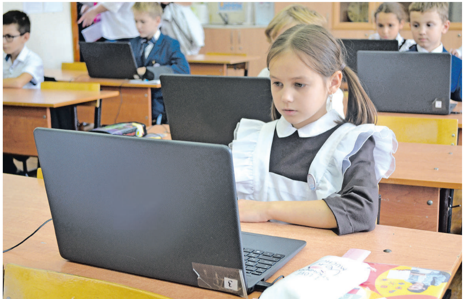
С 1 сентября основы программирования в 13-й школе изучают ученики с 1-го по 8-й класс

К слову, о школьном музее, где хранится на выходных государственная символика. Созданный более 30 лет назад (а восемь лет назад он пережил реконструкцию) Музей боевой славы 23-го гвардейского Белгородского Краснознаменного авиационного полка дальнего действия объединил детей, внуков и правнуков ветеранов полка. Центр внеурочной и исследовательской деятельности дал ребятам, увлечённым краеведением и историей, на опыте понять: их поисковая работа действительно нужна людям! Так,