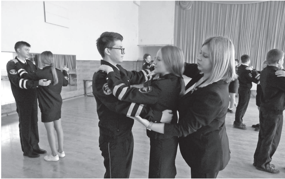
Занятие по хореографии