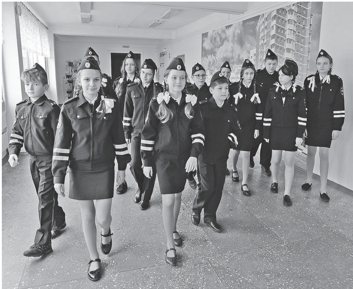
Ученики кадетского класса

ЗА ЧТО МАЛЬЧИШКИ И ДЕВЧОНКИ ЛЮБЯТ СВОЮ ОБЫЧНУЮ ШКОЛУ № 48