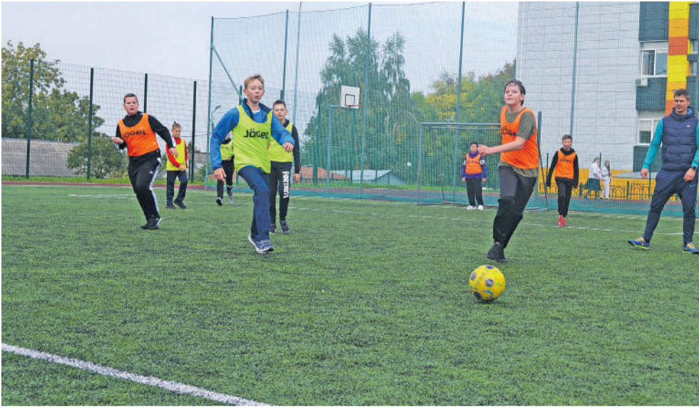
В рамках губернаторского проекта «Решаем вместе» в 13-й школе к 1 сентября открыли новую спортивную площадку с беговыми дорожками, футбольным, баскетбольным полями и даже воркаут-зоной. В планах — доделать разметку на площадке для малышей и зону для игры в теннис

галочки или хорошего отзыва в соцсетях или на бумажном бланке, а по велению души. Иначе не могут. И когда мы заглянули напоследок в кабинет информатики, где собрались «звёздочки»-старшеклассники (к слову, многие планируют связать свою жизнь с IT-специальностями, уверены: за ними будущее), и спросили: «А почему