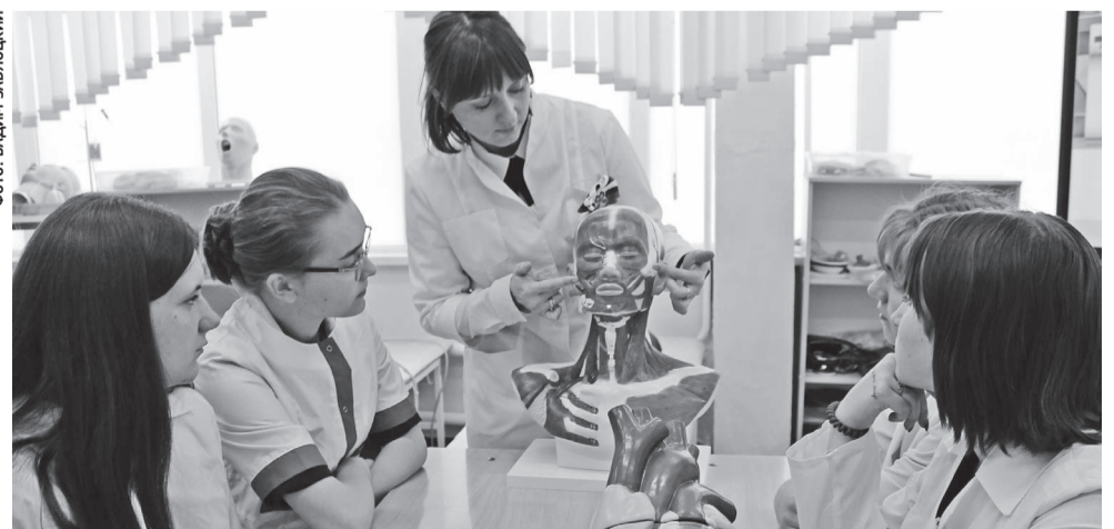
На занятиях в медклассе Валуйской школы № 4

В сентябре БелиРО провёл курсы повышения квалификации для учителей биологии «Преподавание учебного предмета «Биология» на углублённом уровне для обучающихся в медицинских классах», в октя-